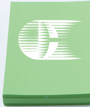
東山中学・高等学校