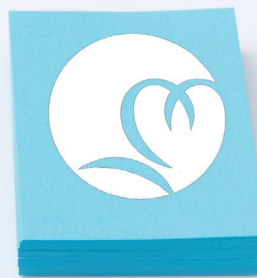
京都橘中学・高等学校