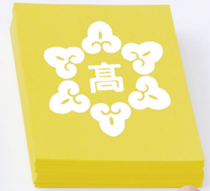
京都文教中学・高等学校