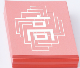
京都翔英高等学校