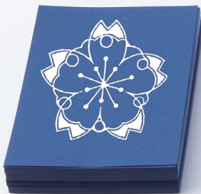
京都精華女子中学・高等学校