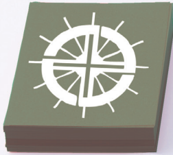
一燈園中学・高等学校