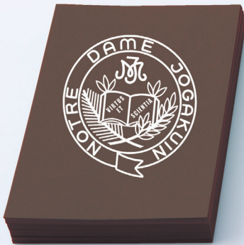
ノートルダム女学院中学・高等学校