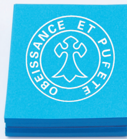
京都聖母学院中学・高等学校