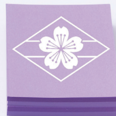
華頂女子中学・高等学校