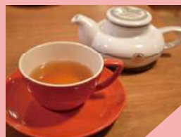
ホットストレートティー クリーミーソフィア 780円（税抜）

宇治紅茶館でしか味わえない、オリジナルフレーバー「クリーミーソフィア」。バニラ、キャラメル、フルーツ 13 種の茶葉を使用。フルーツの優しい香りが口いっぱいに広がります。