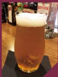
ヒメホワイト 600円(税込)

「京都宇治茶房 山本基次郎」さんのほんず栽培による碾茶を使用したジントニック。碾茶の香りがふわっとして、宇治の魅力を感じる一杯です。