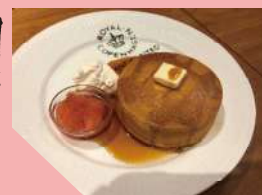
究極のホットケーキ 1,200円（税抜）

特性の銅板で焼き上げているため、外側はざっくり、中はもっちり。自家製のアールグレイティーソースとの相性も抜群の一品。