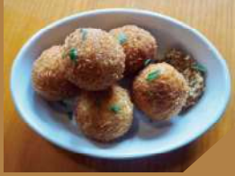
ビタポーレン 600 円 (税抜)

オランダのお肉のコロッケ。お酒との相性が非常に良い一品。マスタードをお好みでつけることにより、味の変化を楽しむことができます。