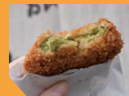
抹茶コロッケ 150円(税抜)

おいもの甘みと抹茶の風味を感じるコロッケ。その場で揚げてくれるのでアツアツが食べられます。全国でここにしかない一品です。