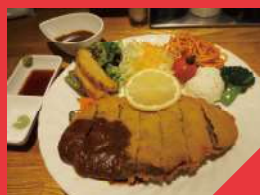
ビーフカツ（ライス付） 1,480円（税込）

わらじカツ（薄いカツ）のビーフカツは、あっさり食べられます。デミグラスソース、わさび醤油、抹茶塩、ウスターソースの4つの味が楽しめます。