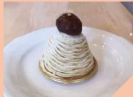
和栗のモンブラン 560円(税込)

クリームがとてもなめらかなのでスポンジとの相性が抜群。熊本県産のマロンクリームも風味も豊かなので、とても美味しいです。