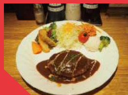
手ごね煮込みハンバーグ（ライス付） 1,080円（税込）

ハンバーグはふわふわ。コクあって甘めのデミグラスソースとよく合い、サラダやスパゲティなど付け合わせも豊富。