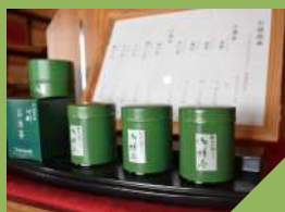
初昔 (抹茶/缶入り 30g) 4,860 円 (税込)

「初昔」とは、茶摘みの最初の日に摘んだ茶葉を使った抹茶の銘。宇治市内の手摘み碾茶を 100% 使用しており、苦みが無く、甘みと旨みを感じられるお濃茶です。