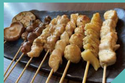
炭火焼とり 10本盛り 1,200円(税抜)

さらっとして食べやすいです。タレは自家製。炭にこだわっており、備長炭を使用。焼き鳥の種類は、日替わりなので、毎回違うものを味わうことができます。単品ではなく盛り合わせにしか存在しない焼き鳥もあるので要チェック！