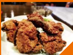
ママ手作りラピスのからあげ 700円(税込)