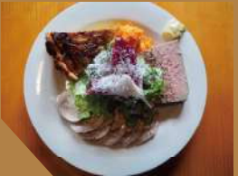
前菜の盛り合わせ 1,500 円 (税抜)

田舎風パテ、ベーコンとキャベツのキッシュ、カルパッチョ。カルパッチョは季節によって食材が変わるため、季節毎に楽しめます。