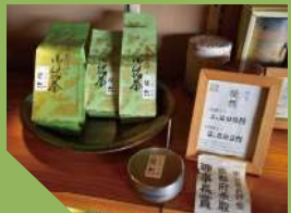
徒然 (煎茶/袋入り 100g) 1,296 円 (税込)

高温で淹れるとあっさりとした味と香りが楽しめ、低温でじっくり淹れるとまったりとした甘み、コクが出るお茶です。