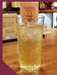
宇治橋通り基トニック 800円(税込)