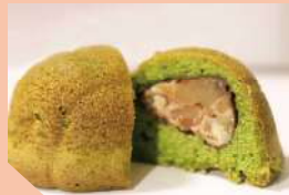
抹茶と渋皮栗のケーキ 300円(税込)

3種類の宇治抹茶をブレンドした生地に、渋皮栗がまるごと1粒入っています。抹茶の風味が豊かで絶品です。