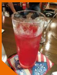
ラピスの酵素ドリンク 700円(税込)