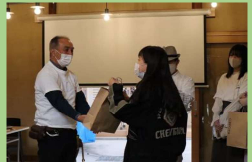
ほしい理由オークション