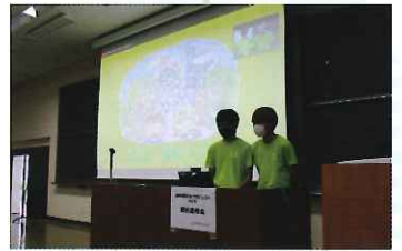
↑宇治☆茶レンジャーの発表風景